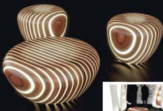
Bright Woods Collection (2010.) - namještaj koji noću svijetli i ispušta ugodne mirise zbog prirodnih smola korištenih u proizvodnji