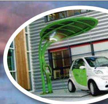
Lotus - 'pumpa' budućnosti