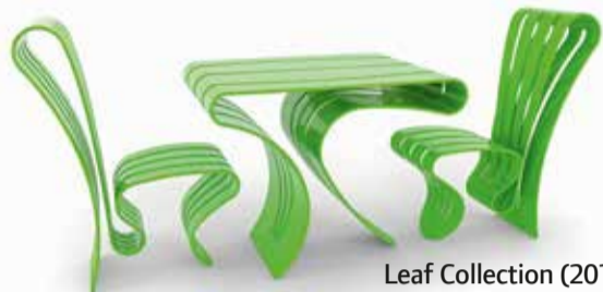
Leaf Collection (2010.) - stol i stolice iz jednog komada koje su zaintrigirale i tehnološke i proizvođače