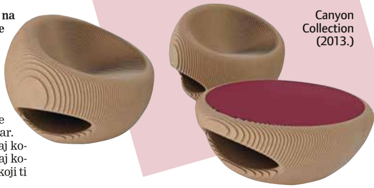
Canyon Collection (2013.)

41-godišnji arhitekt i dizajner iz Rima drži kako arhitektura već sad mora tražiti nove i neistražene izvore, a osobno ga najviše privlači životni horizont vezan uz vodu, tj. more. Svjestan učinka ljudske intervencije na ambijent, Zema stvara 'zelenu' arhitekturu i dizajn, projekte koji prijateljuju s okolišem